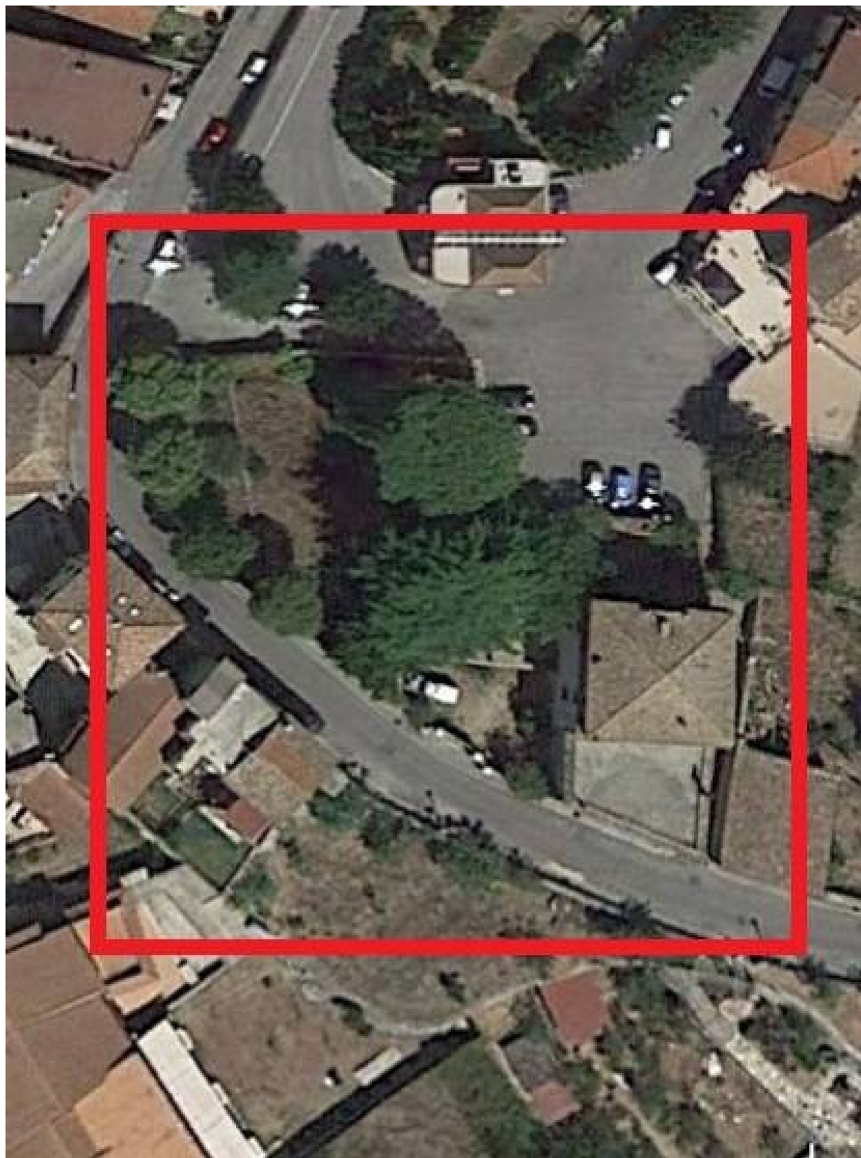
PARTICOLARE FOTO AEREA